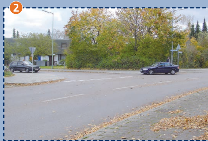
Unübersichtliche Einmündung der Kurparkstraße in den Stiftsbogen