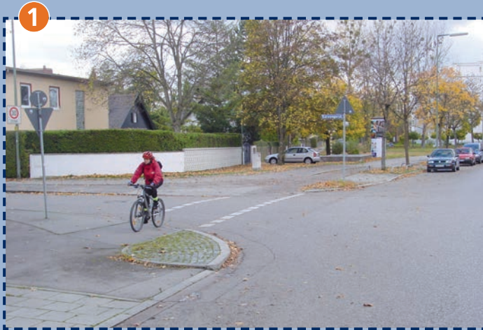
Einmündung der Kornwegerstraße in die Guardinistraße