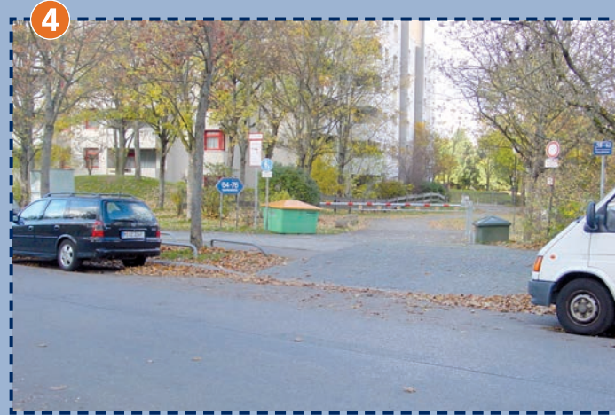
Einfahrt zur Schule von der Guardinistraße aus