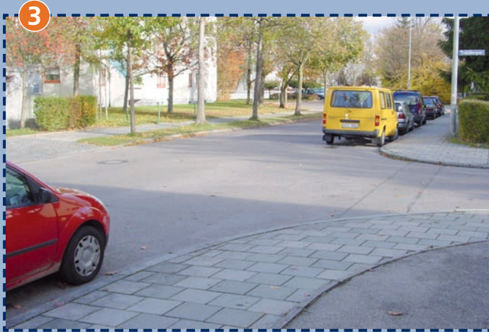
Beispiel für viele Rechts-vor-Links-Straßen im Schulsprengel